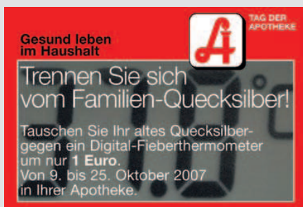
Broschüre (ganz links) und drei Printanzeigen

Konsumenten angesprochen, die gewöhnlich in der Drogerie einkaufen, sondern auch solche, die in erster Linie von Hausapotheken führenden Ärzten versorgt werden.